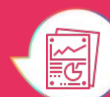
Tab.1 - Distribuzione di casi di notificati per tipologia di infezione e origine del caso (confermati e probabili)